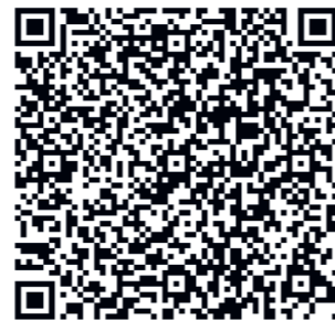
Die schweizerische Bundesverfassung – DIKE Verlag